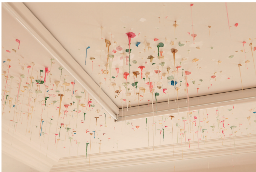
Serena Fineschi, Affresco, Trash Series , 2018 (detail)