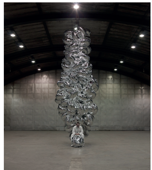
David Rickard, Exhaust , 2011