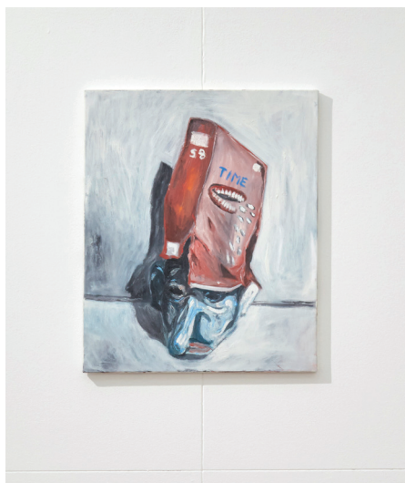
SPAZIOMENSA, Dario Carratta, Senza titolo, 2019