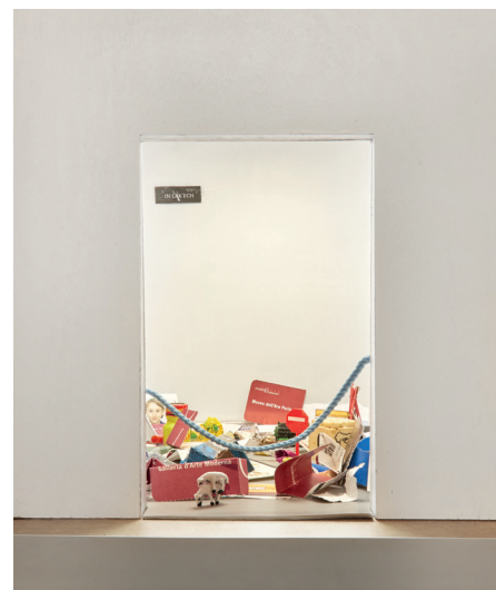
OFFICINA, Spazio Y, Spazio Y, 2021