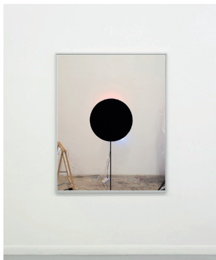
PAESE FORTUNA, Alessandro Dandini de Sylva, Untitled #8723, 2019