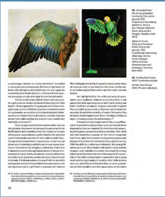
25. Alessandro Mendini 1934 - 2007 Parrot 2007 Fondazione VAF Collezione