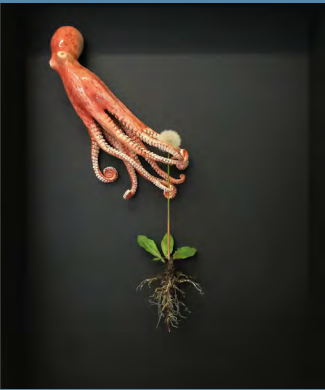
28. Giuseppe Penone 1939 - 2007 Hand 2007 Fondazione VAF Collezione