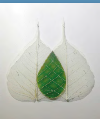
31. Giuseppe Penone 1939 - 2007 Hand 2007 Fondazione VAF Collezione