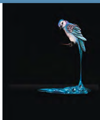
36. Giuseppe Penone 1939 - 2007 Hand 2007 Fondazione VAF Collezione

Una monografia dedicata a un alchimista moderno, L'orMa, che sonda le possibilità inesplorate della materia con spirito e abilità da miniaturista