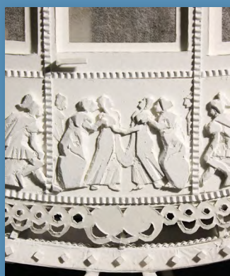
33. Giuseppe Penone 1939 - 2007 Hand 2007 Fondazione VAF Collezione